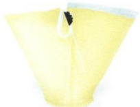
Hitzeresistenter Einhängefilter (im Standard enthalten)